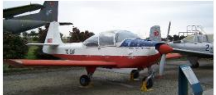
Slat 223 Flamingo (1969- )