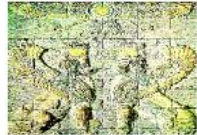
Tarımlar Tanrısı Ahura Mazda ve Sferikler M.Ö. 490, Sus'ta Dara Sarayı