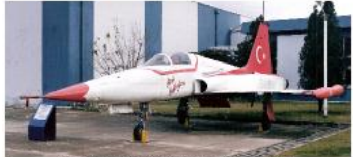
Canadair NF-5A "Türk Yıldızları" (1989- Serviste)