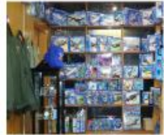
Hatıra Eşya Satış Reyonu