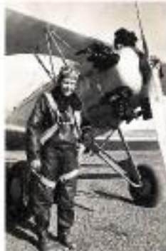
Sabiha GÖKÇEN Consolidated Fleet Tayyaresi ile.

Sabiha Gökçen, Genç Cumhuriyet Döneminde olduğu gibi bugün de Türk kadınları için bir semboldür. Atatürk bunu özellikle değerlendirerek Türk kadınları ve kızları için düşündüklerini yapmalarını istediği şeyleri ilk önce manevi kızı Sabiha Gökçen'e uygulamış, onu her işte öncü yapmış, o başardıkça Türk kadınlarına olan güveni daha da artmıştı. Bu güven o yıllar dikkate alındığında tabii ki boşa çıkmamıştı. Türk kadını her alanda varlık göstermeye başlamıştı. Sabiha Gökçen Türkiye'nin ilk kadın pilotu olmuş. Askeri Uçuş Okulu'nu bitirip dünyanın ilk kadın savaş pilotu unvanını kazanmıştı. Onun hayatında daha bir çok ilk vardı. Tek başına çektiği Balkan Dostluk Turu'nu başarıyla tamamlamış, Türkkuşu'nun ilk bayan başöğretmeni olmuştu.