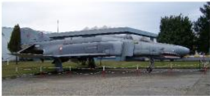
Mc Donnell Douglas F-4E Phantom II (1967-Serviste)