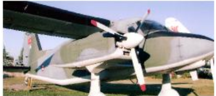
Dornier Do28D-B2 (1983-1988)