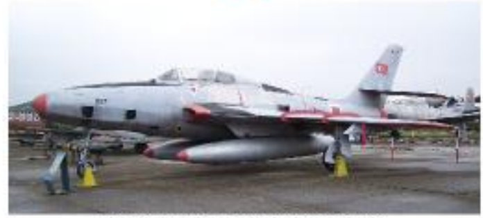
Republic RF-94F Thunderflash (1956-1980)