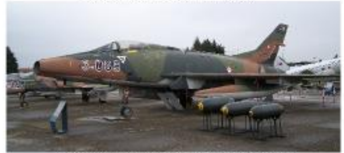
North American F-100C Super Sabre (1972-1968)