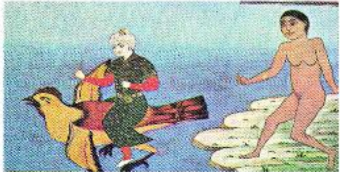
XVIII yy. Acap ve Garip Kitabı, kuş tarafından uçurulan insan minyatürleri, Topkapı Sarayı