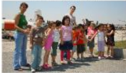
Grup öğrenci gezisi.