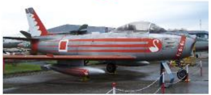
Canadair F-86-E Sabre (1954-1968)