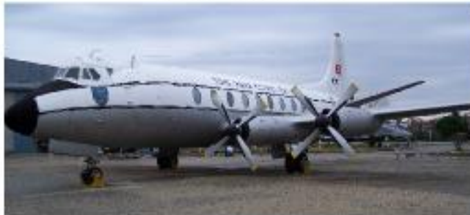
Vickers Viscount 794 (1971-993)