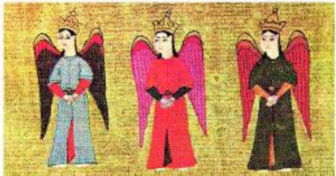
XVIII yy. Acap ve Garip Kitabı, dolaşan melekler, Topkapı Sarayı