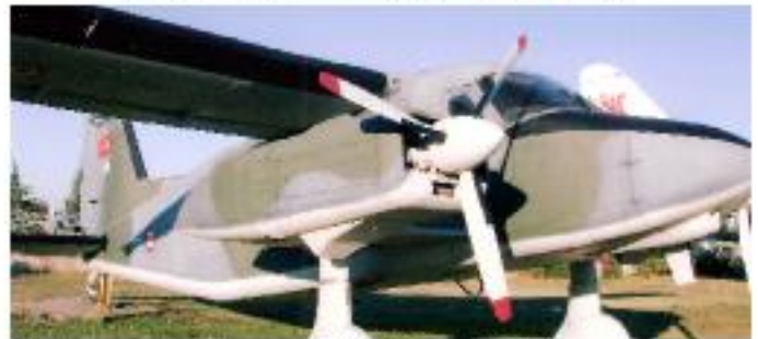
Dornier Do28D-B2 (1983-1988)