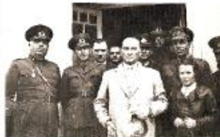
Sabiha GÖKÇEN (M. Kemal Atatürk'ün 1. nci Tayyare Alayı'nı ziyareti, Eskişehir 1936).