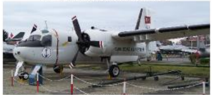
S-2E Tracker (1978-1993)