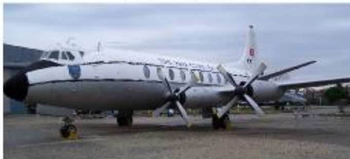
Vickers Viscount 794 (1971-993)