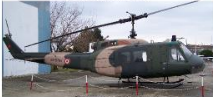
Bell UH-1H (1970-Serviste)