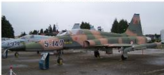
Northrop RF-5A Freedom Fighter (1965-Serviste)