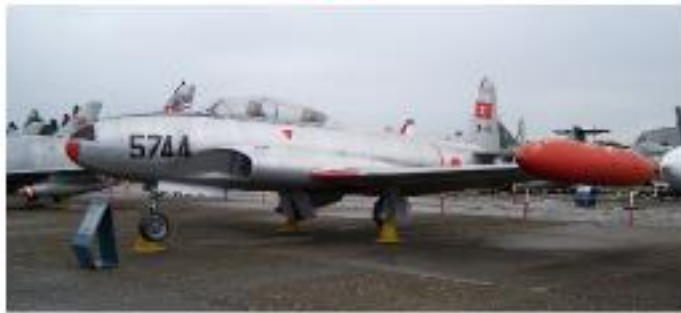
Lockheed T-33A T-Bird (1951-1996)