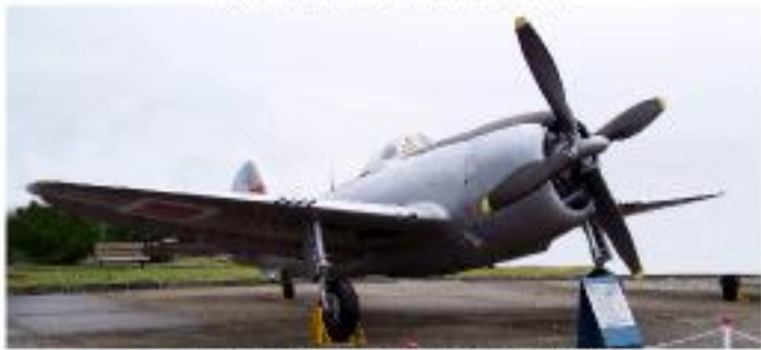
Republic P-47D Thunderbold (1948-1973)