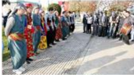
Ergençiller Günü Faaliyeti.