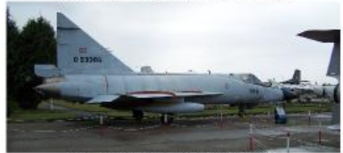
Convair F-102A Delta Dagger (1968-1979)