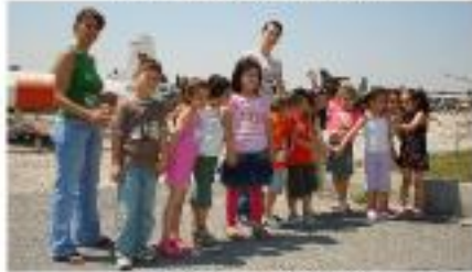
Grup öğrenci gezisi.