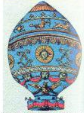
Montgolfier'in sıcak hava balonu 1783'te Paris üzerinde 860 m. uçmuştur.