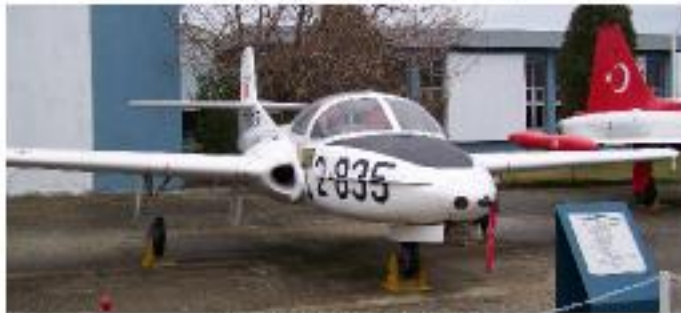
T-37C Cessna (1963-1995)