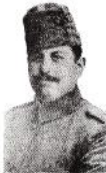
Süreyya (İLMEN) Bey, Havacılık Komisyonu Başkanı