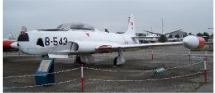
Lockheed RT-33A Shooting star (1951-1997)