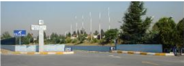
Ücretsiz Müze Otoparkı