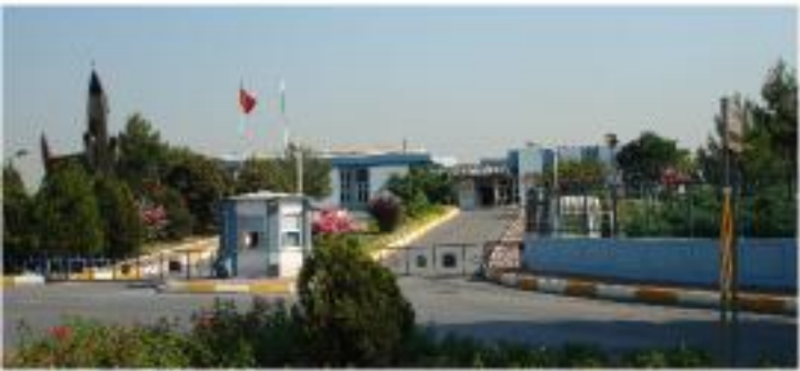
Yeşilköy Hava Kuvvetleri Müzesi.