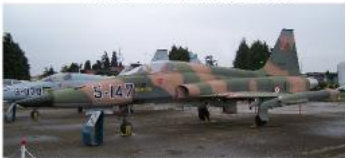
Northrop RF-5A Freedom Fighter (1965-Serviste)