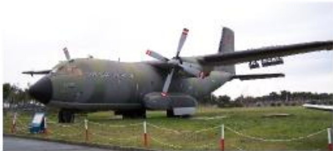
C-160D Transall (1971- Serviste)