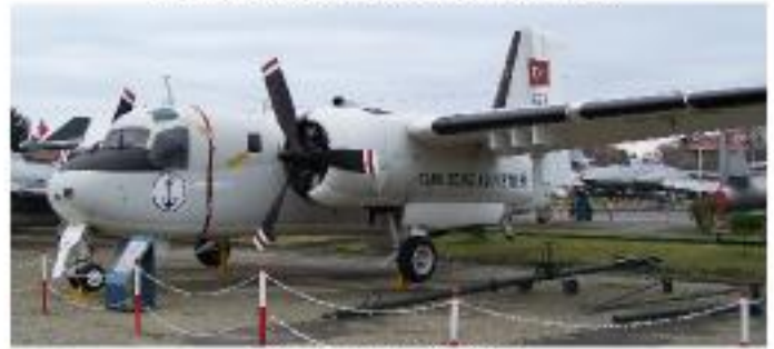
S-2E Tracker (1978-1993)