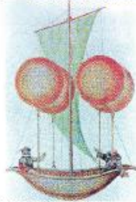
Francesco De Lana'nın Uçan gemi projesi.