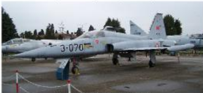
Northrop NF-5A (1969-Serviste)