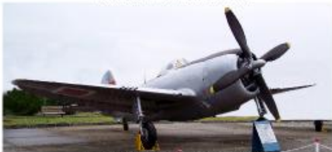
Republic P-47D Thunderbold (1948-1973)