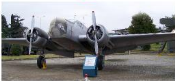
Beechcraft AT-11 Kansan (1948-1983)