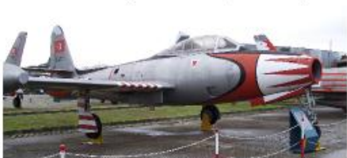
Republic F81 G Thunderjet (1952-1966)