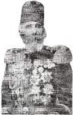
Mahmut Şevket Paşa, Harbiye Nazırı (Milli Savunma Bakanı)