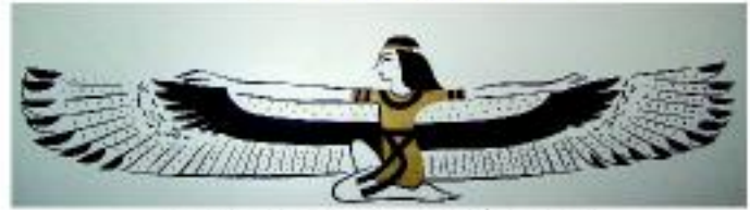
Mısır'ın I. Dönemine ait Tanrıça Isis, Mısır.