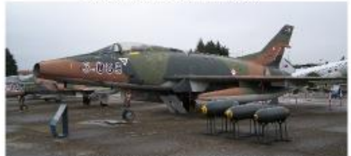
North American F-100C Super Sabre (1972-1968)