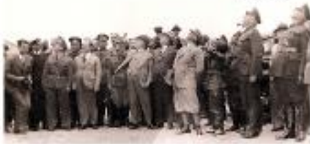
Atatürk ve Sabiha Gökçen uçuşları izlerken.