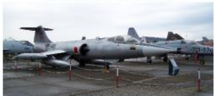
Lockheed F-104G Star Fighter (1963-1994)