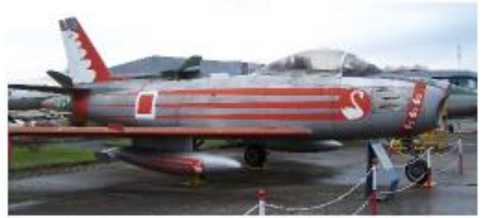
Canadair F-86-E Sabre (1954-1968)