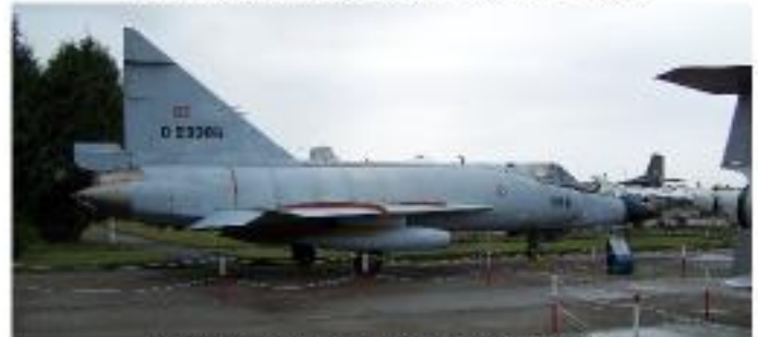
Convair F-102A Delta Dagger (1968-1979)