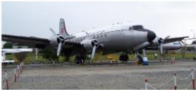
Douglas C-54D Skymaster (1959-1974)