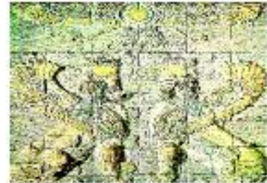
Tarımlar Tanrısı Ahura Mazda ve Sferikler M.Ö. 490, Sus'ta Dara Sarayı