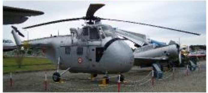
Sikorsky UH-19 Chikasaw (1958-1977)