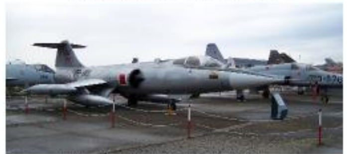
Lockheed F-104G Star Fighter (1963-1994)