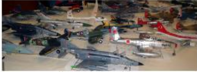
Yarışmaya katılan modeller.

Okullar, randevu almak ve okul müdürlüğünden onaylı dilekçe getirmek suretiyle, Hava Kuvvetleri Müzesi'nden öğretmen ve öğrenciler ücretsiz olarak istifade edebilir ve hoşça zaman geçirebilirler.